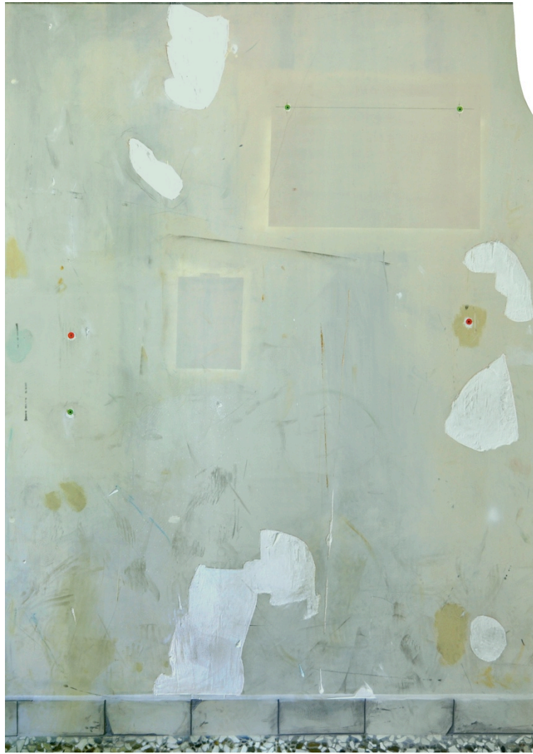
Pintura vidrio 6 © Sfumato, Rui Macedo 2019