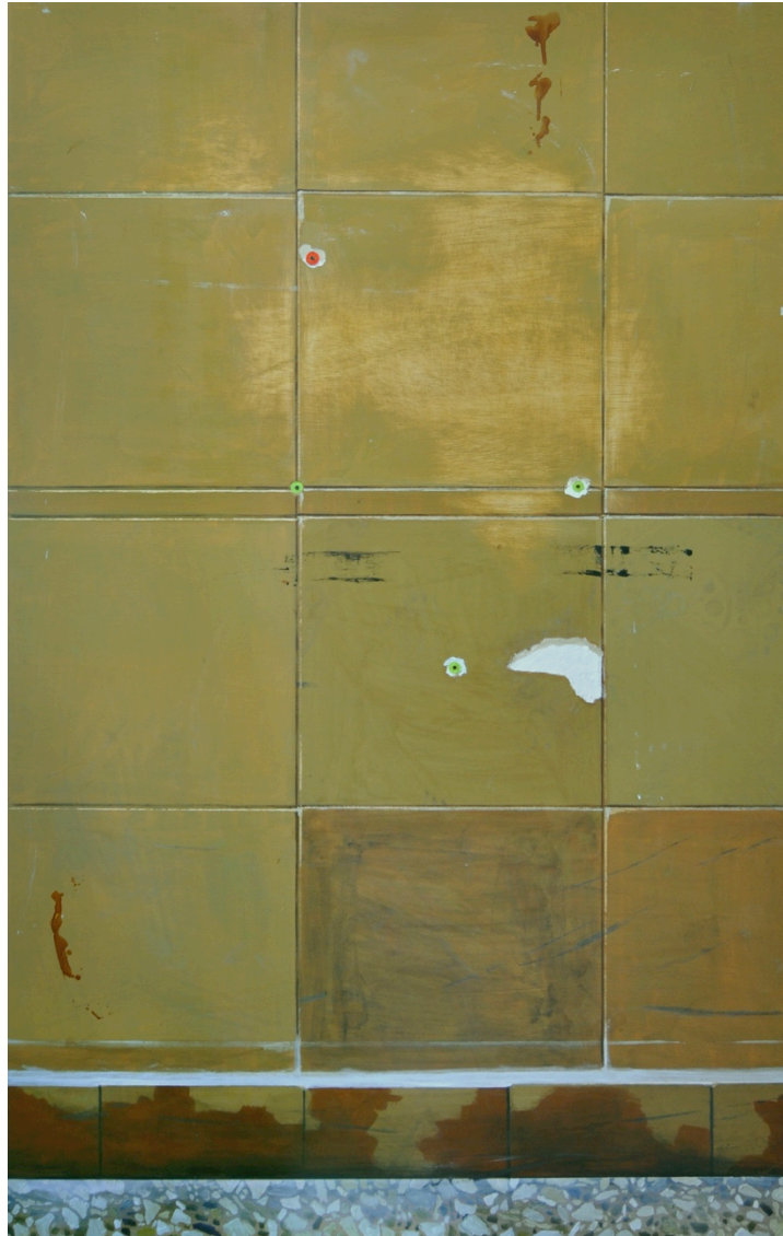
Pintura vidrio 6 © Sfumato, Rui Macedo 2019