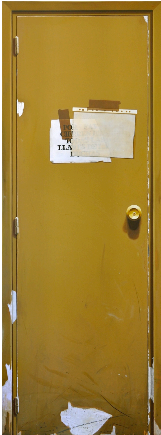
Pintura puerta 3 © Sfumato, Rui Macedo 2019