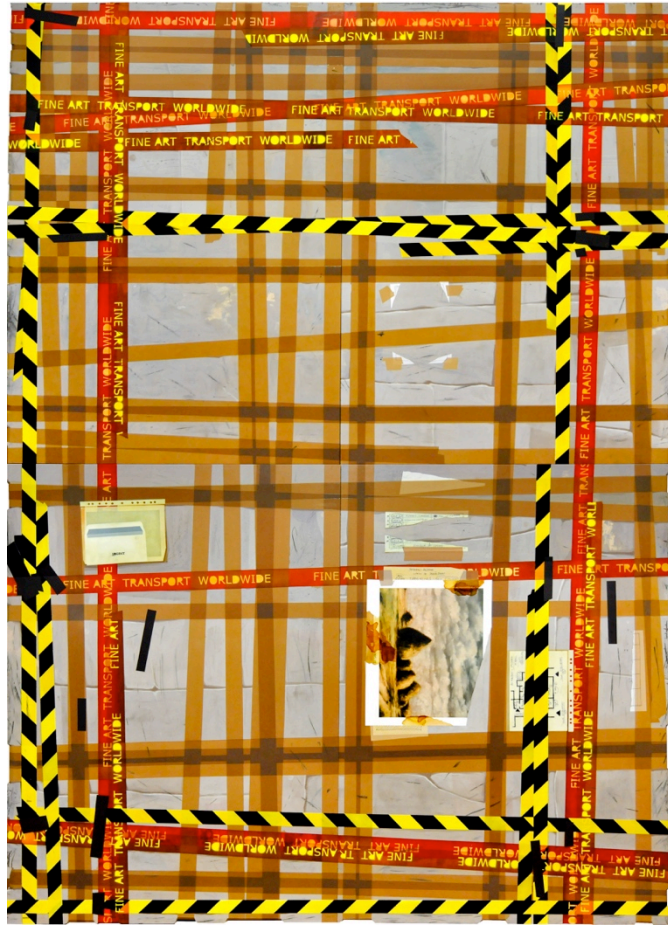
Pintura embalaje © Sfumato, Rui Macedo 2019